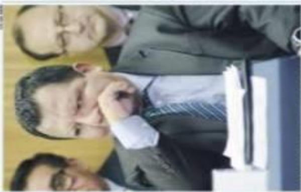
El titular del Fisco Pedro Pablo Kuczynski en un momento de su intervención en el foro.