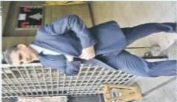
El titular del Fisco Pedro Pablo Kuczynski en un momento de su intervención en el foro.

La vergonzosa historia sobre la protección que a Pedro Pablo Kuczynski le brindó el Ministerio Público a pesar de contar con indicios más que suficientes