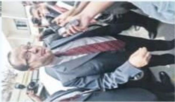
El titular del Fisco Pedro Pablo Kuczynski en un momento de su intervención en el foro.