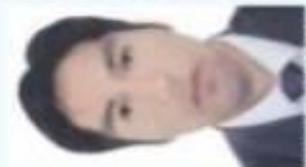
El titular del Fisco Pedro Pablo Kuczynski en un momento de su intervención en el foro.

VIERNES 22 DE DICIEMBRE 2017-AÑO 8-N°378