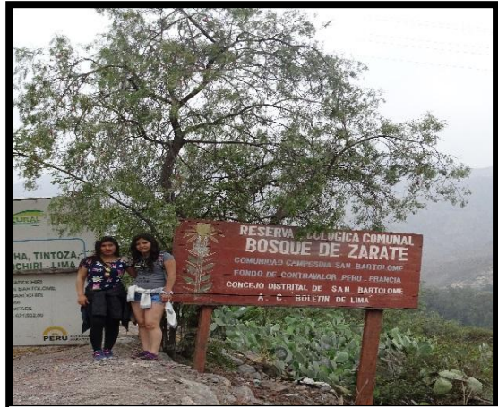
Ingreso al sendero del A.N.P