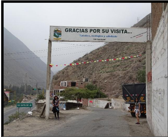
Ingreso al distrito de San Bartolomé