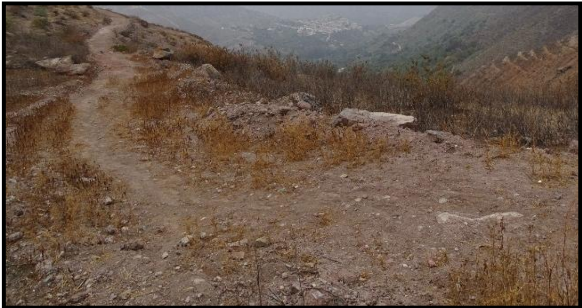
Foto tomada al sendero del Bosque de Zárate