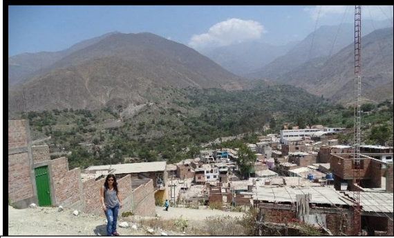
Distrito de San Bartolomé