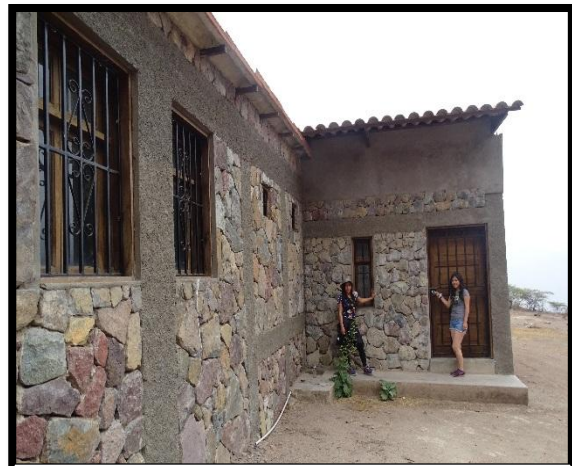
Centro de Interpretación