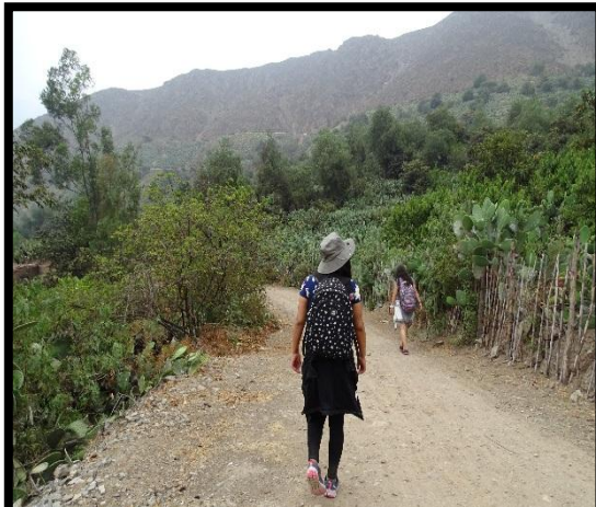
Caminata por el sendero