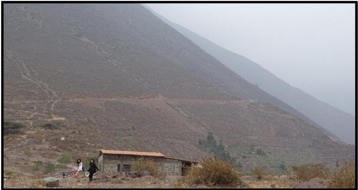
Imagen tomada en el centro de interpretación del Área Natural Protegida