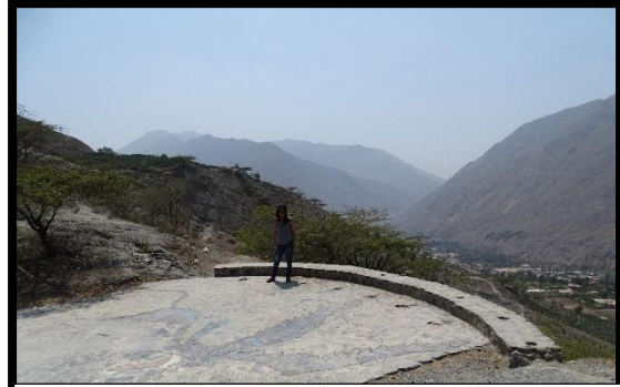
Mirador del centro de soporte