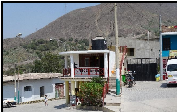
Oficina de Serenazgo