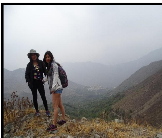
Subida por el sendero