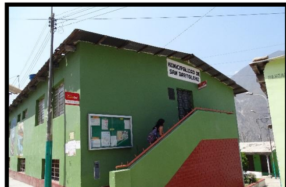
Municipalidad del distrito