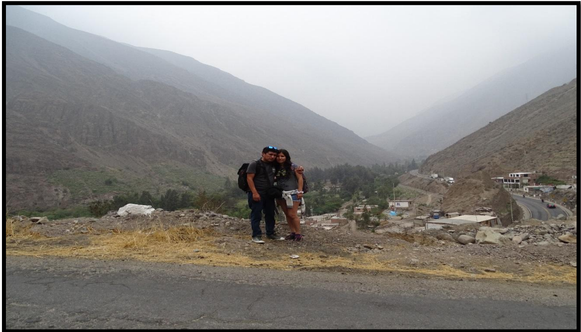
Vista de ingreso por la carretera central hacia el distrito de San Bartolomé