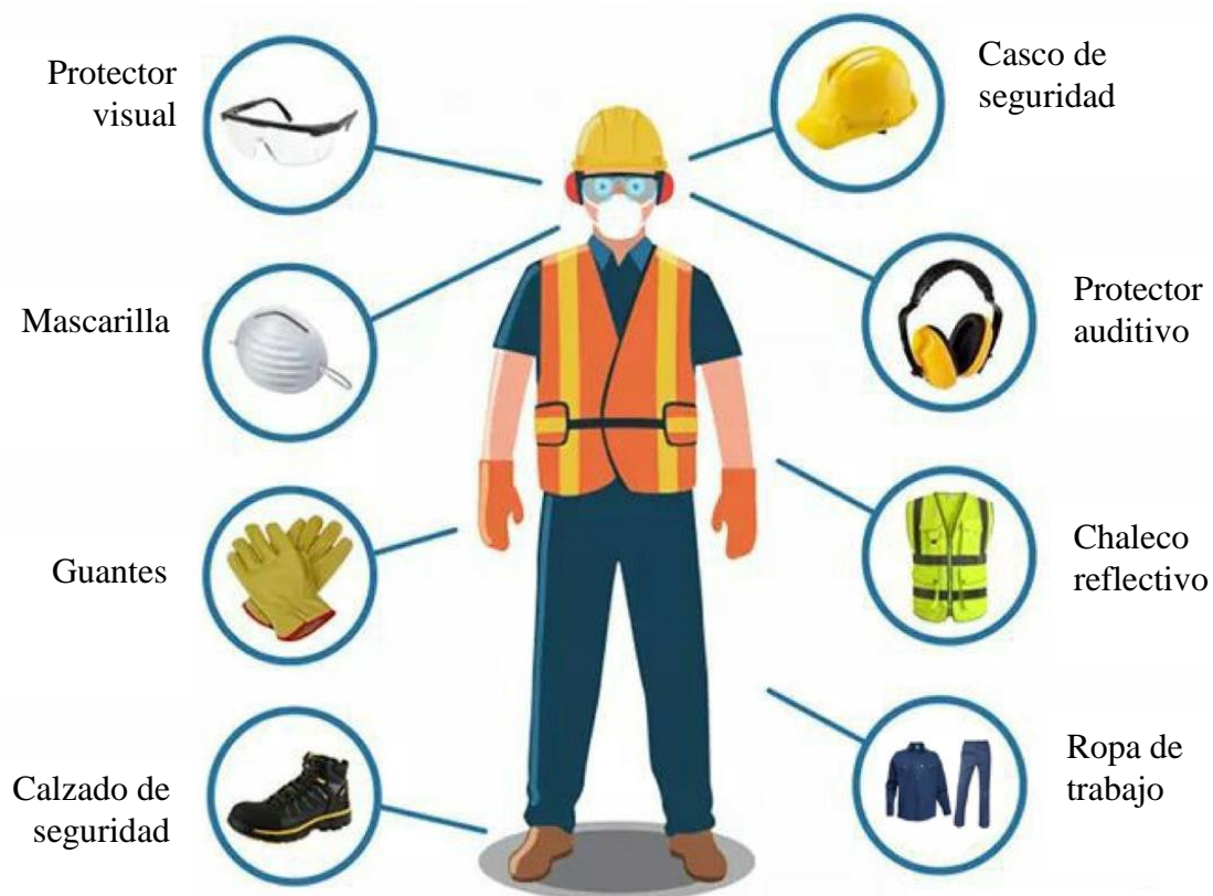
Figura 3. Esquema de los equipos de protección personal (EPP) seleccionados para la empresa.

La séptima actividad consistió en la planificación y dotación de los equipos de protección personal de acuerdo con las características del trabajo que realiza el recurso humano del área de producción. En la Figura 3 se muestra el esquema de los equipos de protección personal (EPP) seleccionados para la empresa: