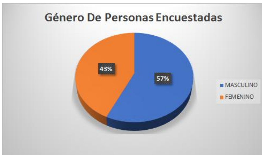
Figura 1. Género de las personas encuestadas

Interpretación: El 52.4% de las personas encuestadas, que es más de la mitad, tienen de 29 a 39 años. El 95.2% de las personas encuestadas tienen hasta 50 años de edad.