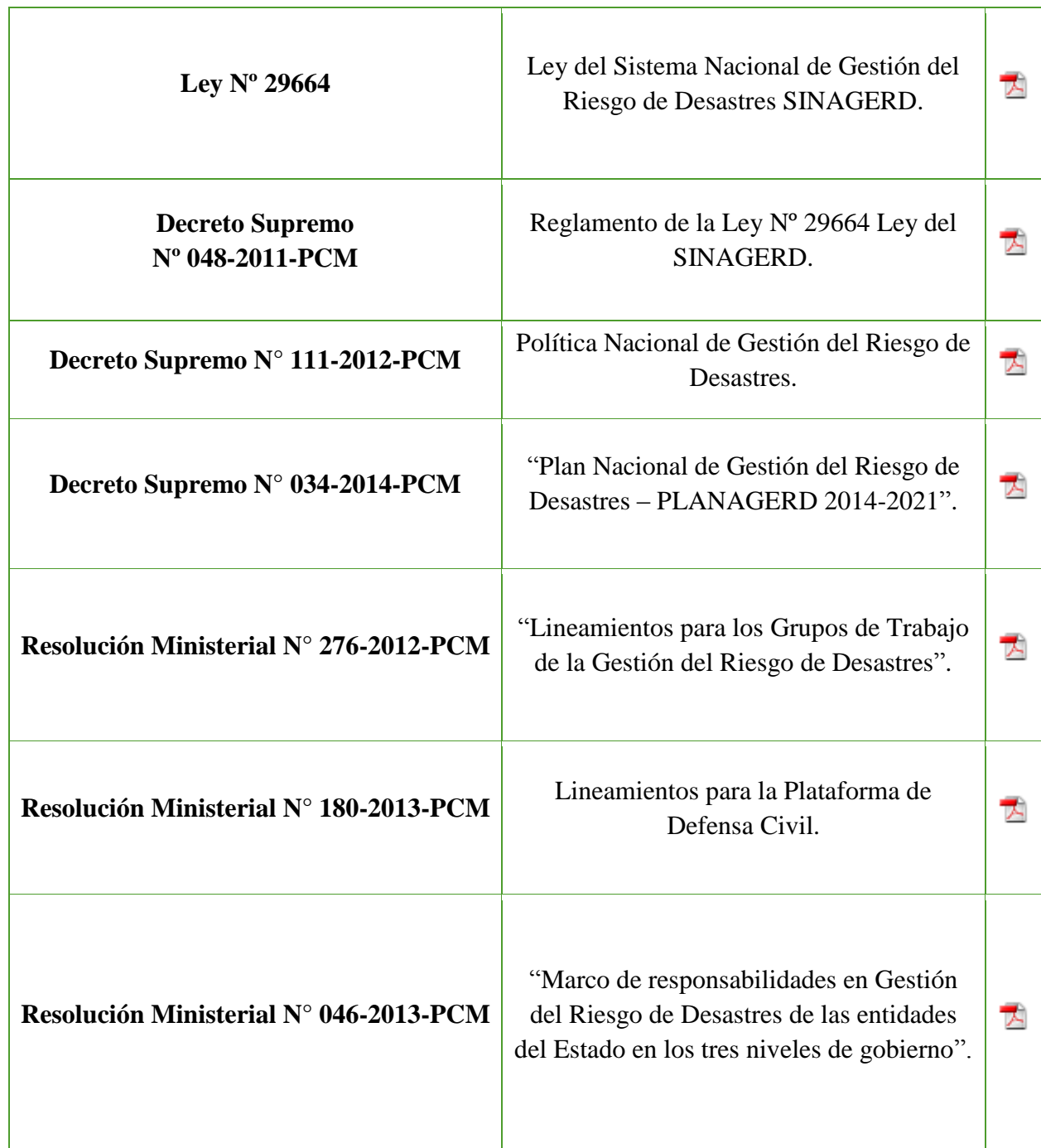
Figura 3: Normas legales de la gestión de riesgos de desastres

local y nacional pos ser de alto riesgo que pone en juego la vida de las personas, los cuales de manera sistemática y programática debe controlarse estos aspectos.