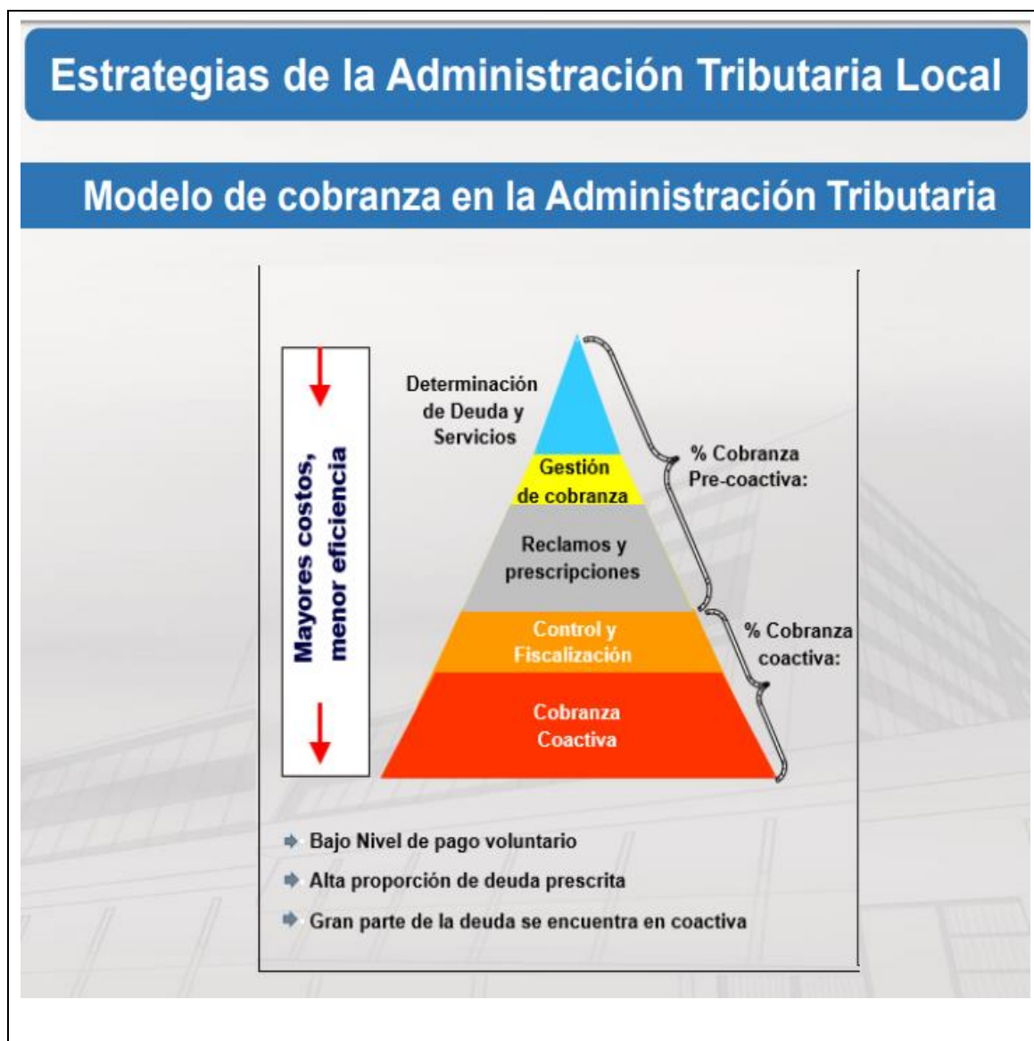
Figura 5: Estrategias de la administración tributaria local