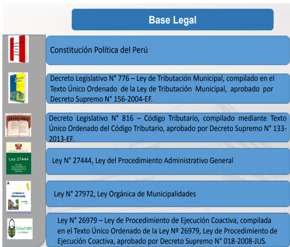
Figura 7: Bases legales municipales

También debemos mencionar que mediante la Ley 27783 se dictó la Ley de Bases de la Descentralización, mediante la Ley 27683 se convocó a elecciones regionales y mediante la Ley 27867 se dictó la Ley de Gobiernos Regionales (Calderón, 2014).