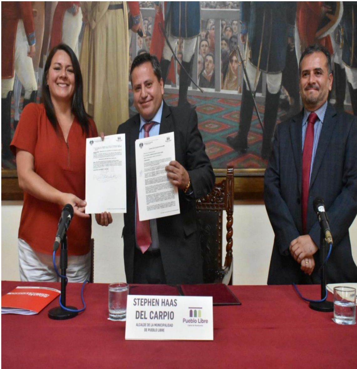
Figura 2: Confianza en las autoridades ediles